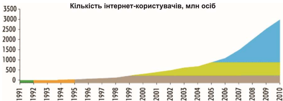
Рис. 1. Головні етапи комерціалізації Інтернету за 1991–2010 рр.

планети та загальної кількості онлайн-покупців (за географічною ознакою), протягом, наприклад, 2014–2019 рр. (табл. 1).