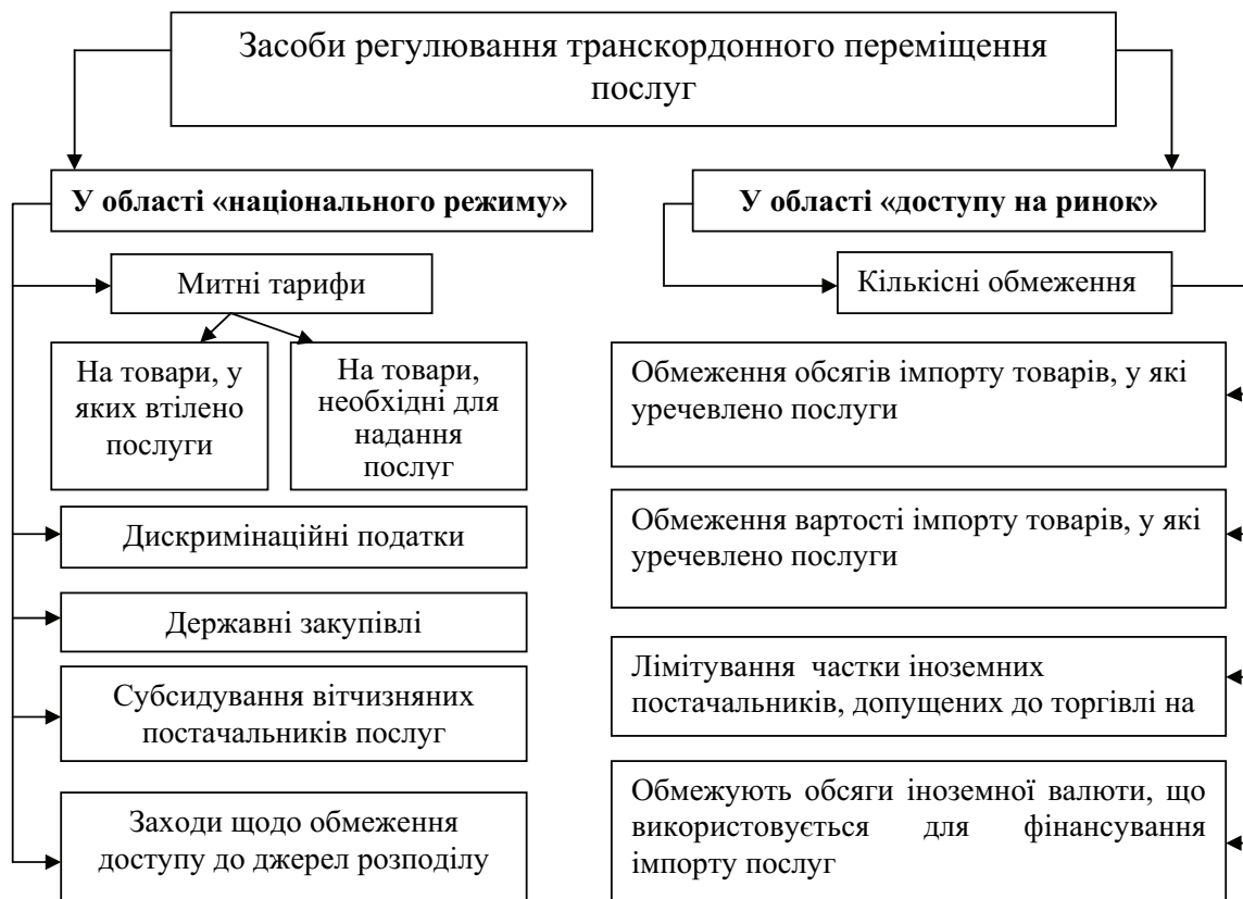
Рис. 1 Засоби регулювання транскордонного переміщення послуг

Заходами у галузі «національного режиму», є митні тарифи, дискримінаційні податки, субсидії, які надають вітчизняним постачальникам послуг перевагу у цінах відносно до іноземних конкурентів. Тарифи можуть застосовуватися як до продуктів, у яких втілено послуги, так як до продуктів, необхідних для надання послуги.