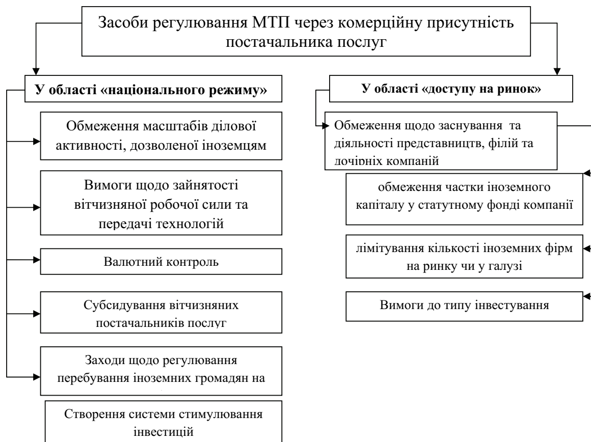
Рис. 3. Засоби регулювання МТП через комерційну присутність постачальника послуг

Характерною рисою даного способу зовнішньої торгівлі послугами є те, що юридична особа іншої країни контролює активи, що знаходяться за кордоном. І хоча прямі іноземні інвестиції є найважливішим методом зовнішньої торгівлі послугами, вони, у більшості випадків, використовуються у супроводі інших способів, таких як тимчасове переміщення персоналу або транскордонна поставка деяких послуг, як, наприклад, виключні знання, торговельні секрети тощо.