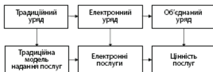
Рис.1. Еволюційний підхід до надання державних послуг [4].

Надання послуг у державному секторі з часом розвинулося від традиційної моделі врядування, що розподіляє послуги традиційними шляхами, до електронного управління й електронних послуг і, врешті-решт, інтегрованого підходу наголосом на цінності послуг для кожного окремого громадянина (див. Рис.1.):