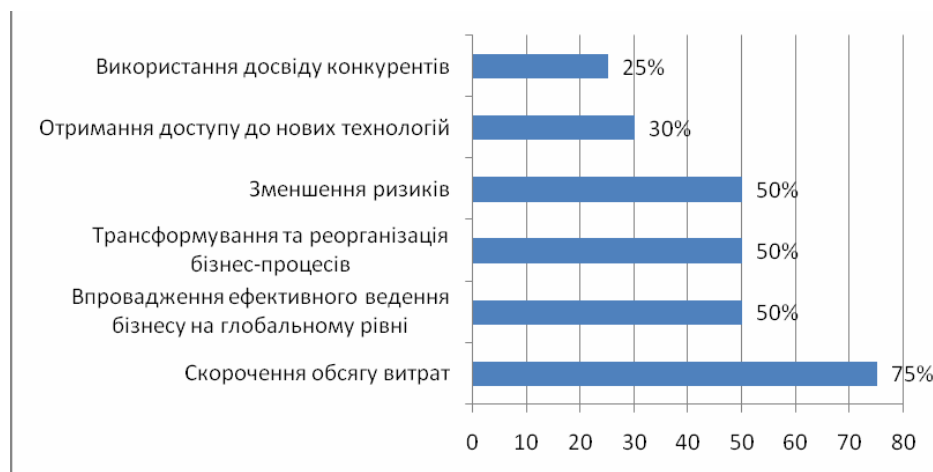
Рис. 2. Фактори розвитку аутсорсингу у посткризовий період

Економічний спад перерозподілив та визначив нові ключові фактори, що впливатимуть на розвиток аутсорсингу та пристосування бізнесу до нового ринкового середовища (рис. 2) [3] [5].