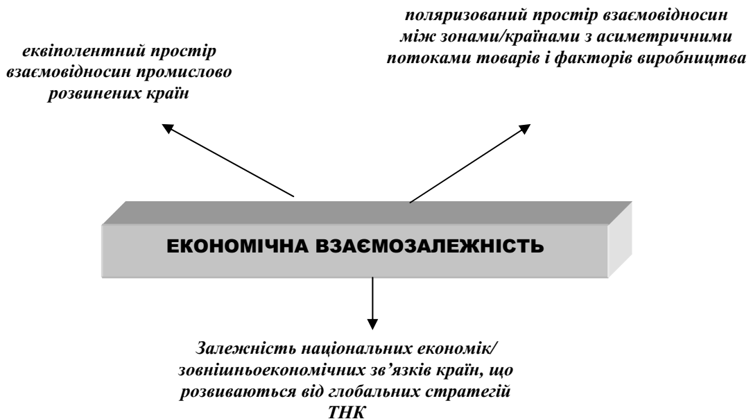
Рис. 2 Форми економічної взаємозалежності

необхідністю врахування державами глобальних викликів сучасності. Більше того, проблема глобальної нестабільності набуває нового окреслення: так, циклічні асиметрії в розвинених країнах набувають дедалі більшого загострення при спробі адаптації уніфікованої економічної політики в межах країн-членів інтеграційного угруповання. Триваюча криза додала ще й інший феномен - країни, що розвиваються, стають заручниками не лише наслідків циклічних змін, що відбуваються в розвинених країнах світу, але й нециклічного спаду останніх, спричиненого, в першу чергу, назрілими структурними проблемами та бульбашковою складовою їхніх економік. Нестабільність поступово стає звичайною ознакою функціонування глобальної економічної системи, що ускладнює процес адаптації потенціалу національних економік до потреб економіки глобальної. Слід визнати ще й таке: інституційна недосконалість інтеграційних об'єднань розвинених країн світу на кшталт ЄС поставила під сумнів їхню здатність забезпечувати стабільність макроекономічного середовища наявним інструментарієм без поглиблення політичної інтеграції, формуючи підвалини для остаточного переміщення центру прийняття економічних рішень з рівня національного на наднаціональний рівень.