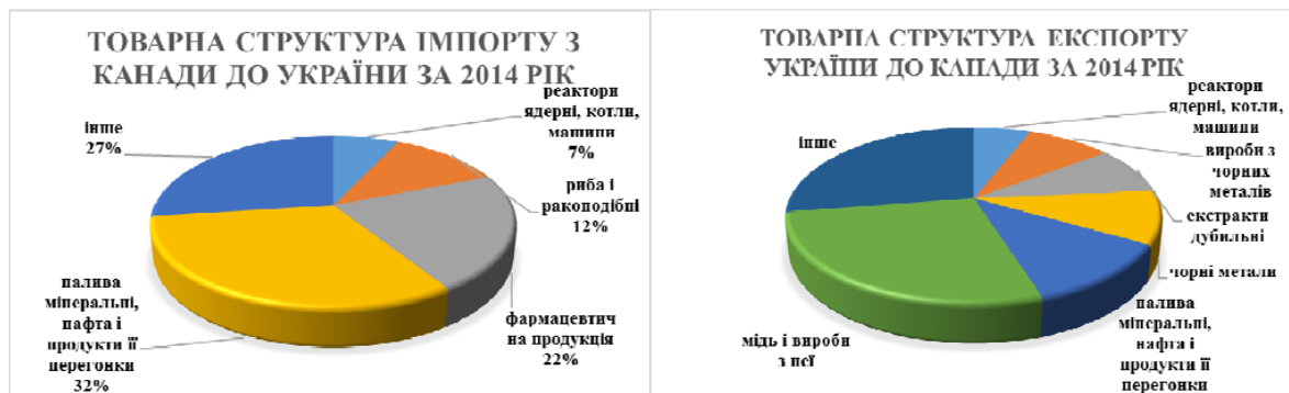
Рис. 2. Товарна структура торгівлі з Канадою за 2014 рік.

В товарній структурі експорту з України переважали: мідь і вироби з неї (27,8%), палива мінеральні (12%); нафта і продукти її перегонки (12%), чорні метали (9,5%), екстракти дубильні (8,9%). Імпорт в Україну з Канади представлений наступними товарами: палива мінеральні (31,8%); нафта і продукти її перегонки (31,8%), фармацевтична продукція (22,2%), риба і ракоподібні (11,8%), реактори ядерні, котли, машини (7,4%) (рис. 2) [8].