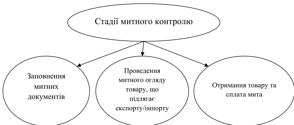
Рис. 3. Стадії митного контролю в Україні.

Порядок здійснення митного контролю визначається Кабінетом Міністрів України відповідно до норм Митного кодексу. Митний контроль здійснюється на території України і включає 3 стадії (рис. 3).