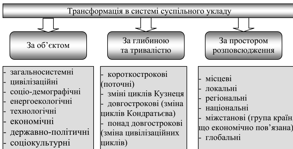
Рис. 1. Класифікація трансформацій суспільних систем.

Ю. В. Яковец [1] в своїй монографії «Глобальні економічні трансформації XXI століття» пропонує наступну класифікацію трансформацій (рис. 1).