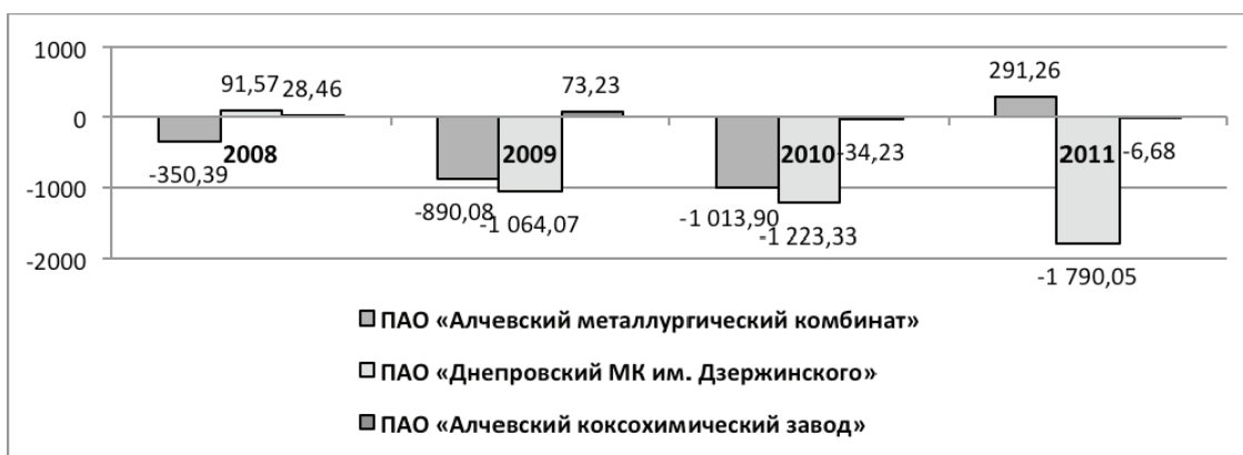
Рис. 3 Чистая прибыль предприятий ИСД в 2008-2011 годах, млн. грн. [4, 3, 6].

В 2010 году капитальные инвестиции компании в украинские металлургические предприятия составили свыше 300 млн. грн. (около 37 млн. долл.), в 2011-том – 490 млн. грн. (около 60 млн. долл.). Общий объем инвестиций с 2005 до 2011 составил 2,7 млрд. долл. Пик инвестиционной активности пришелся на 2007 год, когда ИСД вложила в свои заводы свыше 1 млрд. долл. (масштабная модернизация, проводимая за счет кредитов, и стала одной из причин критического положения компании во время кризиса) [7].