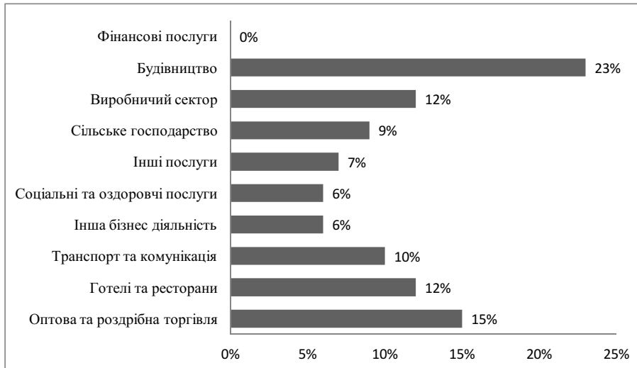
Рис. 2 Відсоток тіньової економіки Європейському Союзу у кожному з секторів, частину тіньової економіки Європи. 2011р.[8]

слуг, туризму, будівництві та інше. Не задекларовані доходи включають заробітну платню та доходи малого бізнесу, а також бухгалтерські засоби ухиляння від сплати податків. Цей сегмент розповсюджено у будівництві, сільському господарстві, сфері послуг та складає майже дві третини всієї тіньової економіки Європи (рис.2).