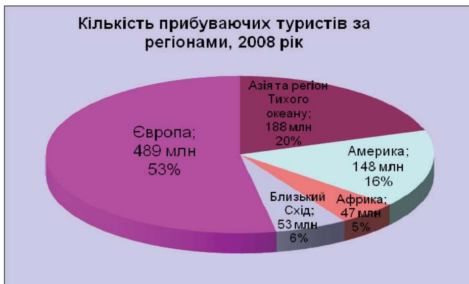
Прогнози на 2009 рік [1]

• The UNWTO Confidence Index був найнижчим за всю його історію, відлік якого почався в 2003 році. Майже 300 членів Групи фахівців UNWTO дали 2008 року загальну оцінку 98, що на 45 пунктів нижче минулорічної.