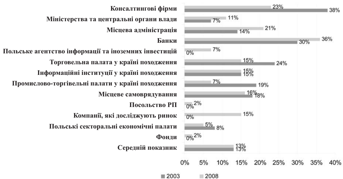
Рис.4. Оцінка допомоги з боку прорахованих інституцій у реалізації інвестицій в Польщі (% відповідей «дуже і добре»)

Слід також підкреслити відносно хорошу оцінку місцевої адміністрації – 21% опитаних назвали допомогу з її боку хорошою або дуже хорошою. Це тим більш цікаво, оскільки кількість позитивних оцінок у даному випадку суттєво збільшилась по відношенню до року 2003 (тоді 14%). Роль місцевого самоврядування у притягуванні ПІІ сьогодні є великою. Саме місцева влада найкраще розбирається в конкретних регіонах і знає як можна привабити інвестора до розміщення капіталу. Практика показує, що очікування на вирішення локальних проблем центральною владою може внаслідок призвести до втрати цікавої інвестиції.