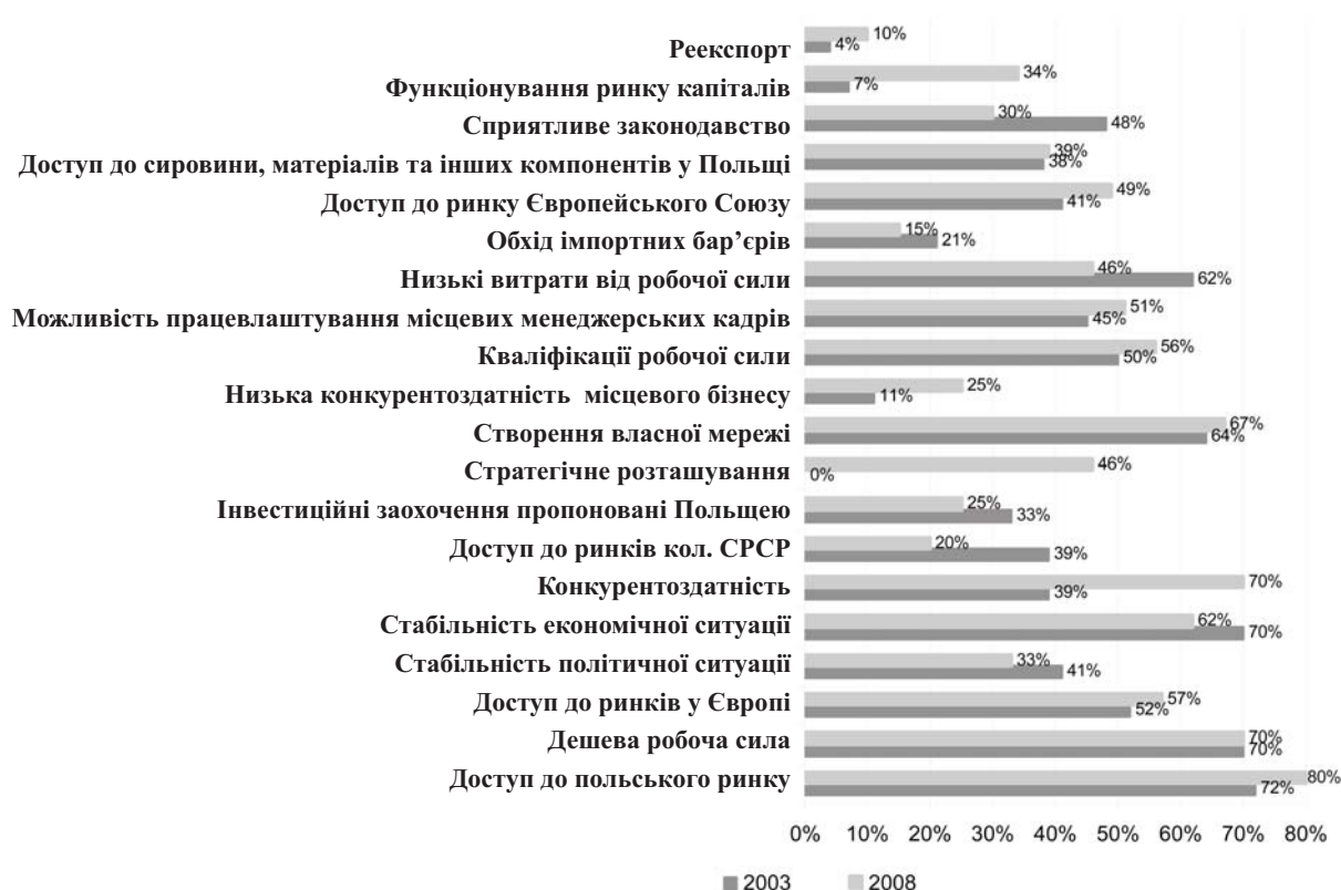
Рис.3. Мотиви стимулюючі ПІІ в Польщі (% відповідей «важливий»)